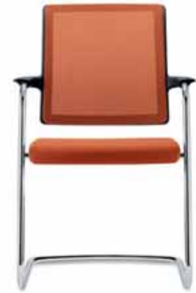
Freischwinger, mit Armlehnen