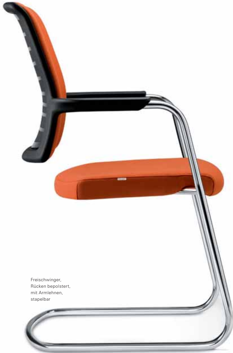
Freischwinger, Rücken bepolstert, mit Armlehnen, stapelbar

Goal-Air in der Ausführung als Freischwinger rundet das Gesamtbild im Büro ab: mit bepolstertem Rücken oder mit NetZRücken.