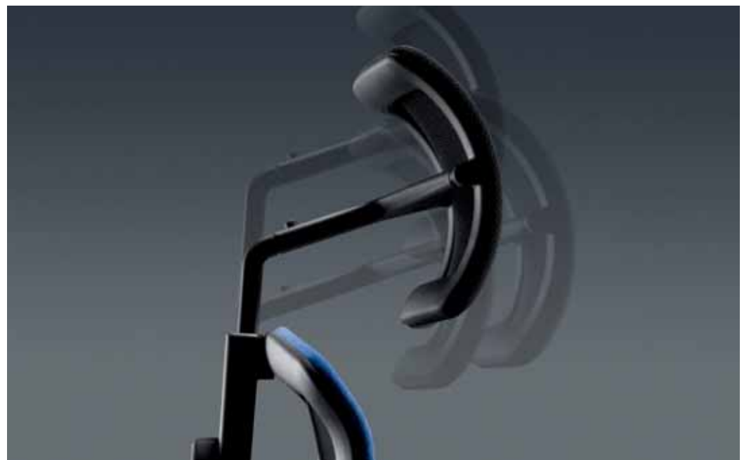
Die Kopfstütze ist in der Höhe, Tiefe und Neigung verstellbar