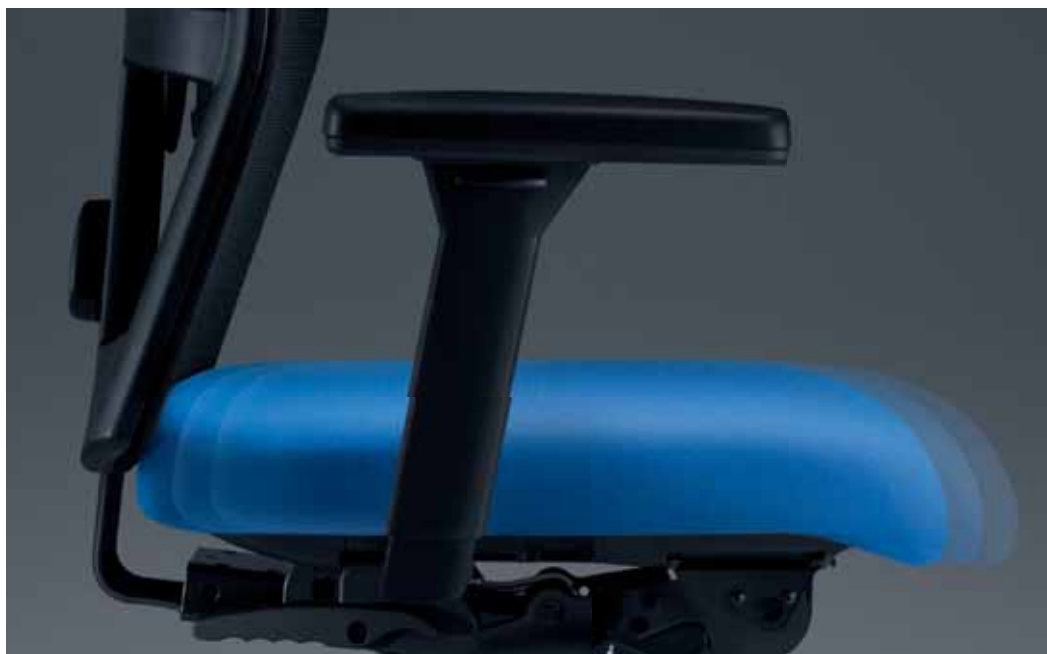
Die Sitztiefenverstellung ermöglicht eine individuelle Einstellung auf die Oberschenkelänge