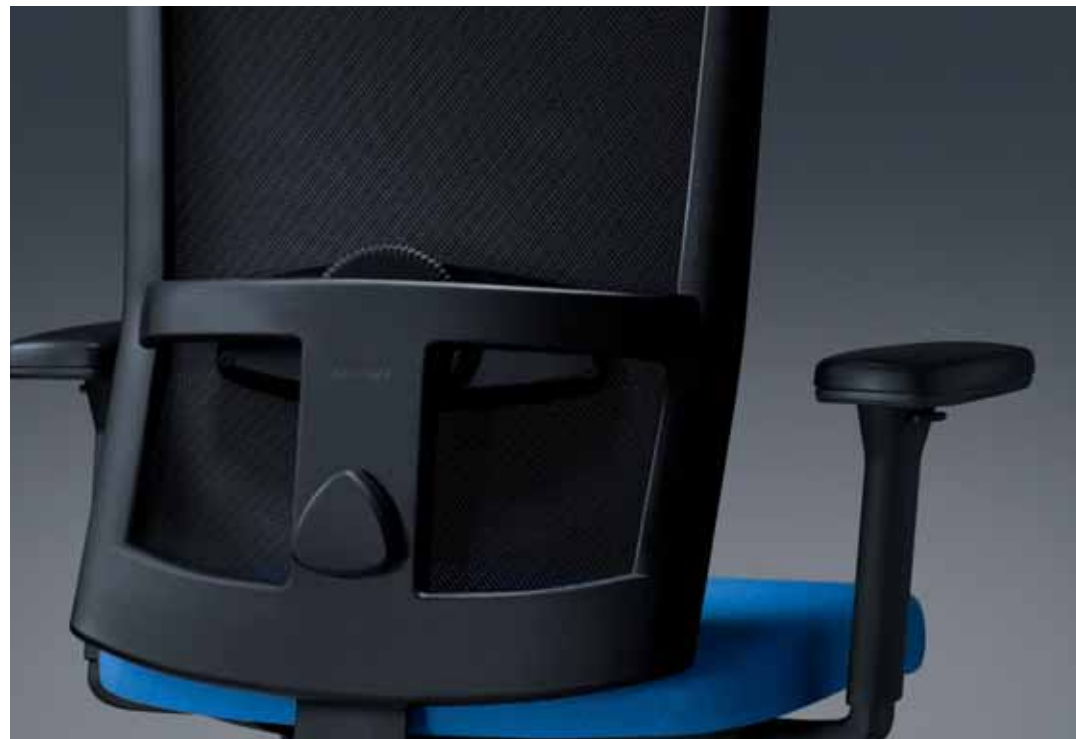
Formschön gestalteter und geschwungene Rückenlehne, Verarbeitung mit Detailliebe