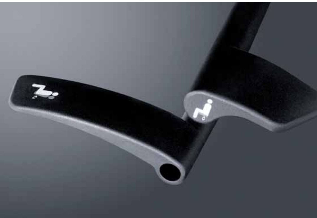
Intuitive Bedienhebel zur Einstellung auf das Körpergewicht, breites Spektrum von 45 Kg –130 Kg